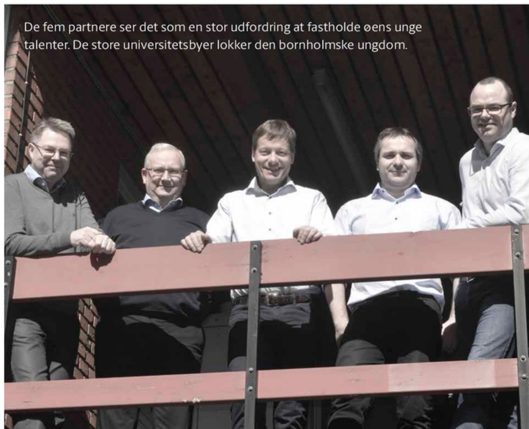
De fem partnere ser det som en stor udfordring at fastholde øens unge talenter. De store universitetsbyer lokker den bornholmske ungdom.

“De seneste fire-fem år har indbyggertallet ligget omkring de 40.000. Rønne Revisions bestræbelser på at tilbyde og drive en attraktiv arbejdsplads udgør naturligvis kun en lille brik i den samlede indsats fra både politikere, erhvervsorganisationer og uddannelsesinstitutioner. Og så må man sige, at det årlige Folkemøde i Allinge har øget omverdenens opmærksomhed på vores lille samfund og sat gang i en række lokale aktiviteter.”